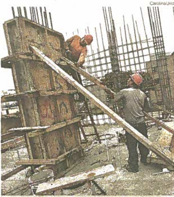
El 70% de las construcciones en viviendas son informales. Es decir, se cuenta con ciudades barriales.