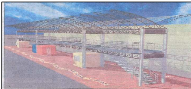
Gamarra será un centro comercial moderno, atractivo y de fácil acceso